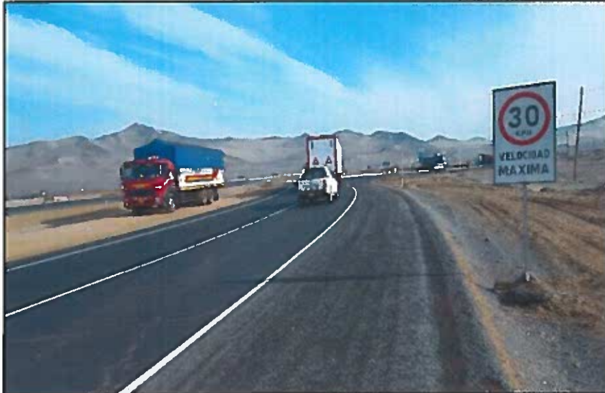
Fotografía 2: Bandas de fresado en operación