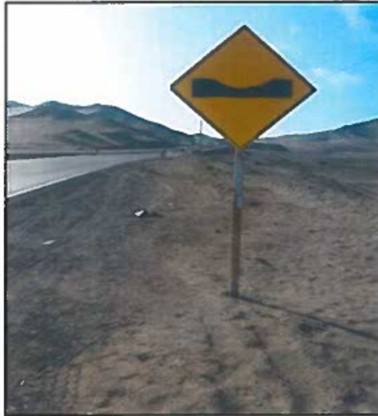
Fotografía 4: Construcción de Bandas de fresado Acceso Norte Ovalo Tortugas