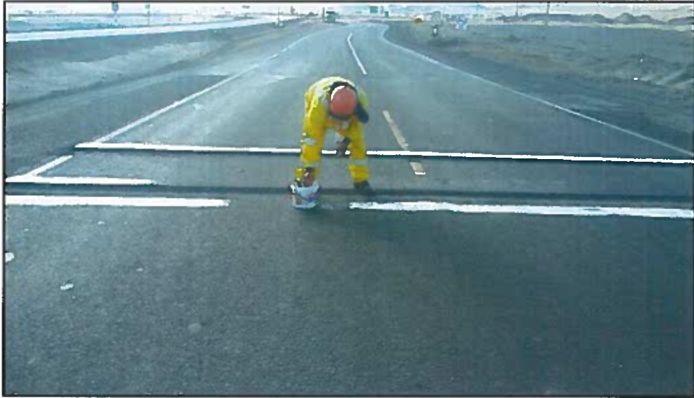
Fotografía 6: Cerca al óvalo Samanco 408+500